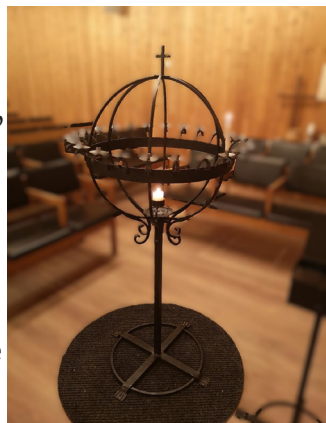
Vi har fått en lysglobe i gave, den sto i Bjølsen Metodistkirke.

Måtte vi kjenne trygghet og håp, også når ting oppleves tunge og mørke, i forvissningen om at Lyset alltid skinner i mørket, og mørket kan ikke overvinne det.